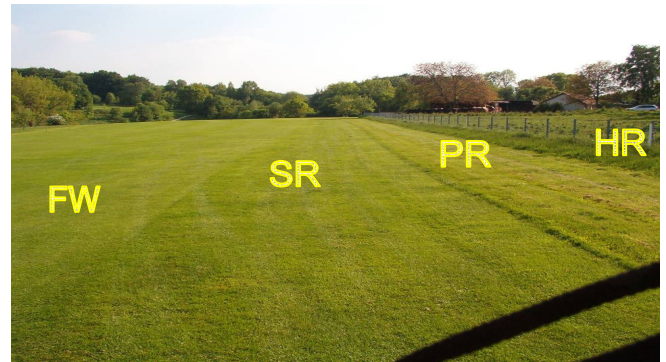
FW=Fairway, SR=Semirough, PR=Playable Rough, HR=Hardrough

Landebereich: Bereich des Fairways, auf dem die Treibschläge landen („Drivezone“).