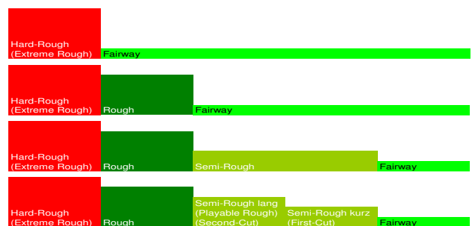
Schematische Darstellung unterschiedlicher Schnitthöhen einer Spielbahn (Grafik: H. Schneider)

- Hardrough/Extremes Rough/Rauh-Fläche: extensiv gepflegte Vegetationsfläche außerhalb der Spielbereiche, z. B. ungemähte Grasflächen (länger als 15 cm), Sträucher, sowie Sanddünen und Waste Areas (Waste Bunker).